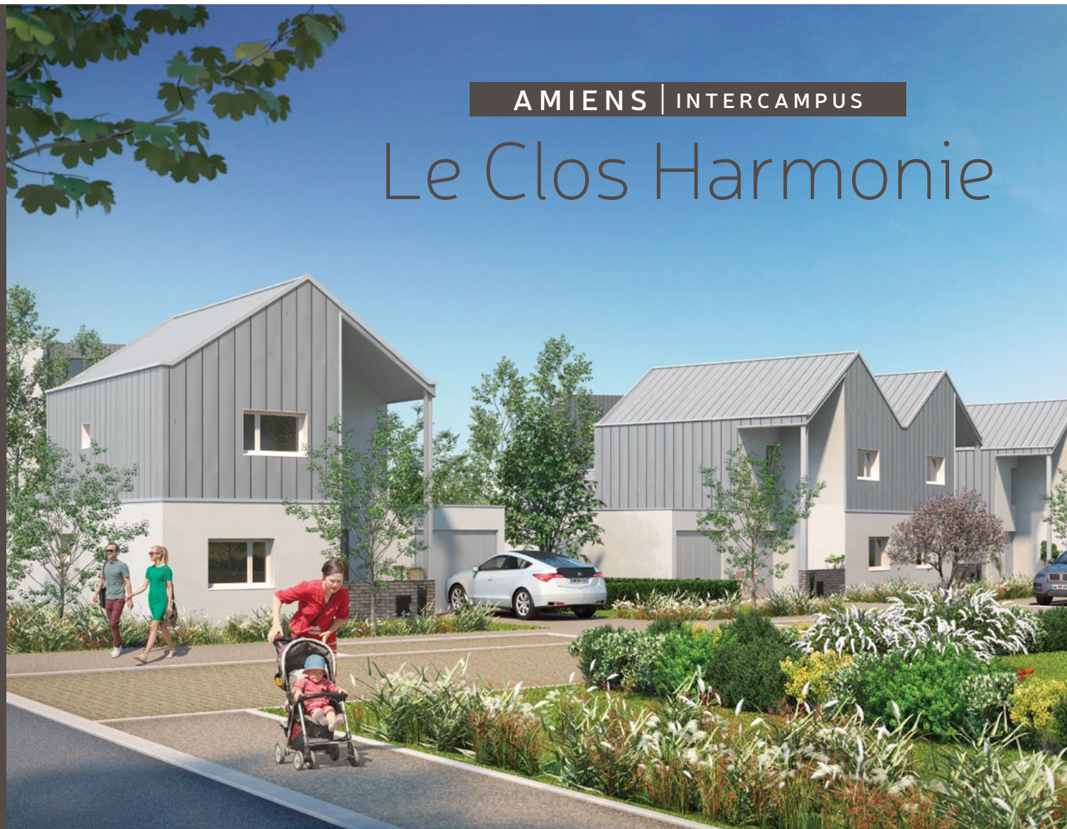
Image de synthèse et axonométrie non contractuelles.